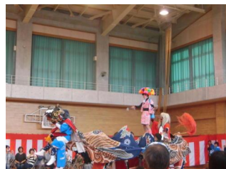
獅子舞〔久々江青年団〕