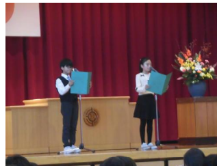
児童代表「小学校の歴史」