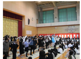
お笑いステージ〔雷鳥〕