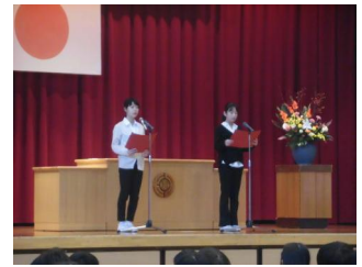
児童代表「感謝の言葉」