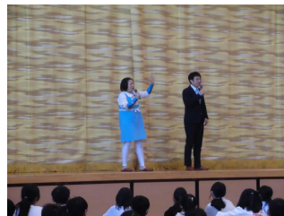
お笑いステージ〔雷鳥〕