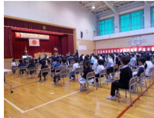
創立150周年記念式典