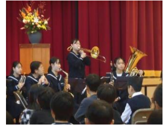
射北中学校吹奏楽部