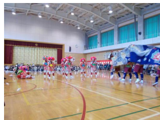
獅子舞〔高場青年団〕