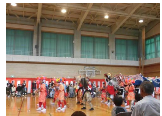
獅子舞〔片口青年団〕