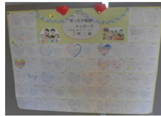
あったか家族メッセージ